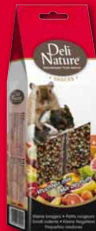
Kleine Nagetiere Früchte mix - 80 gr