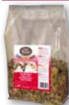
Zwergkaninchen 3 kg