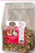
Meerschweinchen 3 kg