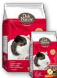
Meerschweinchen 800 gr - 3 kg