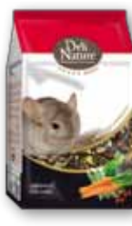
Chinchilla 2,5 kg