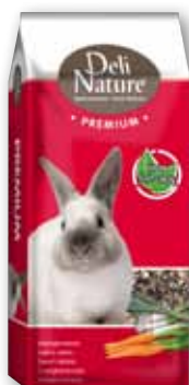
PREMIUM Zwergkaninchen Junior - 15 kg Zwergkaninchen - 15 kg Zwergkaninchen Sensitiv - 15 kg