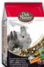
Zwergkaninchen Sensitiv 2,5 kg