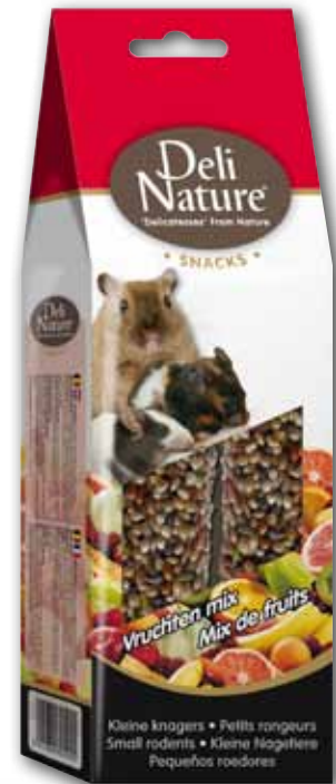
Kleine Nageltiere Früchte mix - 80gr