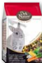
Zwergkaninchen JUNIOR 2,5 kg