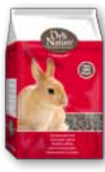
Kaninchenpellets 4 kg