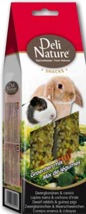
Zwergkaninchen & Meerschweinchen Gemüse mix - 80gr

Deli Nature Snacks sind schmackhafte & gesunde Snacks voller wichtige Nahrungsstoffe, abgestimmt auf die Bedürfnisse Ihrer Nager/Kaninchen