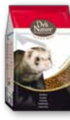
Frettchen 2,5 kg