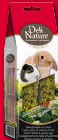
Zwergkaninchen & Meerschweinchen Gemüse mix - 80 gr