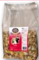
Hamster 3 kg