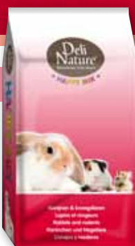
Zwergkaninchen - Meerschweinchen - Kleinnager 15 kg