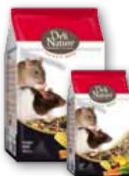
Ratten 750 gr - 2,5 kg