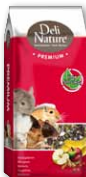
PREMIUM Kleinnager - 15 kg Chinchilla - 15 kg