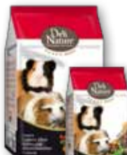
Meerschweinchen 750 gr - 2,5 kg