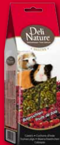
Meerschweinchen Waldfrüchte + extra Vit. C - 80 gr