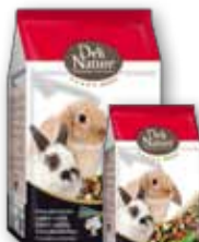
Zwergkaninchen 750 gr - 2,5 kg