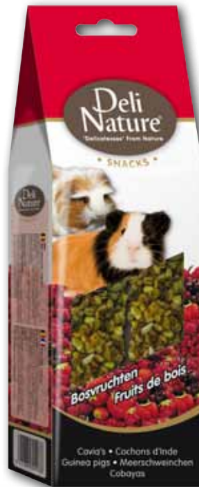
Meerschweinchen Waldfrüchte + extra Vit. C - 80gr