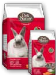
Zwergkaninchen 800 gr - 3 kg