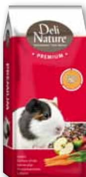
PREMIUM Meerschweinchen - 15 kg